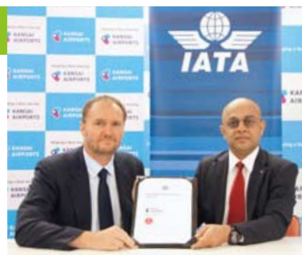
IATAが進める認証「CEIV Pharma」の取得を目指す

今後は、航空機と定温庫の間を温度管理しながら輸送する搬送具「保冷ドリー」の台数を増やすほか、貨物ハンドリング従事者へのトレーニングも強化。ハードとソフトの両面から、さらに高品質な医薬品輸送を提供していく。