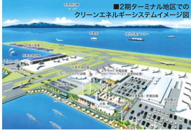
■2期ターミナル地区での クリーンエネルギーシステムイメージ図

国内初となる空港施設への水素エネルギー導入の実証事業「水素グリッドプロジェクト」を特区事業として、2014年度から本格始動。関