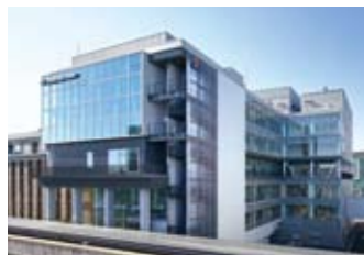
神戸アイセンター

※「自家移植」は自分の細胞・組織を自分の他の部分に移植すること。「他家移植」は他人の細胞・組織を移植すること