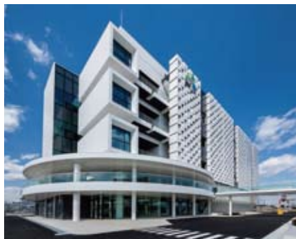
神戸ポートライナー「京コンピュータ前」駅の北側に 位置する神戸医療イノベーションセンター

阪神・淡路大震災以降、神戸市は復興事業 として神戸医療産業都市の整備に力を入れて きた。すでに340を超える医療関連企業や大 学が集積するなど、国内最大級のバイオメ ディカルクラスター（生物・医療関連企業や研