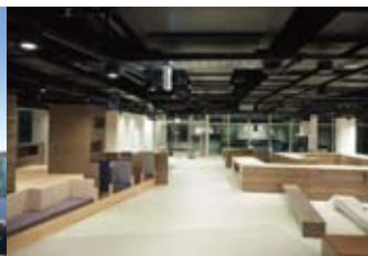
神戸アイセンター2階のビジョンパーク