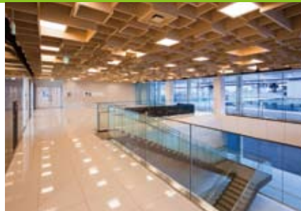
来訪者を出迎える吹き抜けのある交流ホール