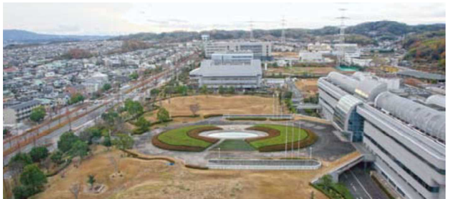
けいはんな学研都市の中心部

プロジェクトの目標は、科学技術と生活文化の融合による「持続可能なモデル都市づくり」を進めて、エコをけいはんな学研都市の文化にすること。そのため、太陽光発電などの再生可能エネルギーや電気自動車の大量導入をはじめ、人々のライフスタイル全体を視野に入れた新たな社会システム「スマートコミュニティ」の在り方を総合的に検討。ICTを活用し、