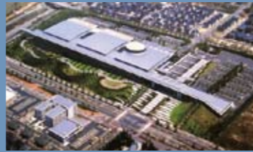
게이한나 오픈 이노베이션 센터

국유재산법 특례에 따라 '나의 직업의 집'이 국가에서 교토부로 무상양도되면서 '게이한나 오픈 이노베이션 센터(KICK)'가 신설되었습니다. 산학연대 연구사업이 진행되고 있으며, 또 '교토 스마트 시티 엑스포'를 비롯해 대규모 행사의 행사장으로 사용되는 등 스마트 커뮤니티 분야를 주축으로 국제적인 오픈 이노베이션 거점을 형성하기 위하여 노력하고 있습니다.