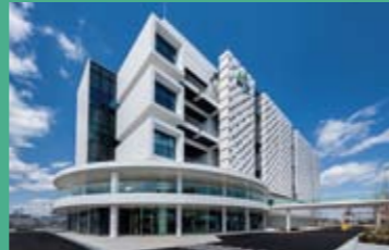
고베 의료 이노베이션 센터

※종합특구 추진조정비 : 종합특구 구역계획을 지원하기 위하여 각 부처의 예산제도를 중점적으로 활용하고, 부족한 경우에는 내각부에서 각 부처의 예산으로 바꾸어 기동적으로 대처하고 보완하는 제도입니다.