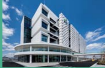
神户医疗创新中心

有效运用综合特区推进调整费(※),在神户医疗产业都市建成了创新药物研发基地“神户医疗创新中心”。为了加快创新性药物、再生医疗等领域的研发,除了向制药相关企业以及创新药物企业等提供入驻场地以及满足再生医疗等产品开发所需的细胞培养空间之外,还完善了对于入驻企业的匹配以及产品化支持等各项软性辅助体制。 ※综合特区推进调整费:为了支持综合特区计划的实现,在重点地运用各政府机构预算制度的基础上如仍存在资金缺口,将由内阁府向有关政府机构进行预算转拨,机动性地予以补充。