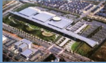
京阪奈開放创新中心

根據國有財產法的特例，實現了將「我的工作館」從國有到京都府的無償轉讓，建成了「京阪奈開放创新中心（KICK）」。這裡除了透過產學合作開展研究事業外，還作為「京都智慧城市博覽會」等大型活動的會場使用，不斷採取舉措推進以智慧社區領域為核心的國際型開放創新基地的形成。