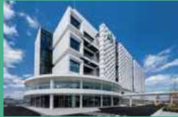
神戶醫療创新中心

有效運用綜合特區推進調整費（※），在神戶醫療產業都市建成了創新藥物研發基地「神戶醫療创新中心」。為了加快創新性藥物、再生醫療等領域的研發，除了向製藥相關企業以及創新藥物企業等提供入駐場地以及滿足再生醫療等產品開發所需的細胞培養空間之外，還完善了對於入駐企業的匹配以及產品化支援等各項軟性輔助體制。 ※綜合特區推進調整費：為了支援綜合特區計劃的實現，在重點地運用各政府機構預算制度的基礎上如仍存在資金缺口，將由內閣府向有關政府機構進行預算轉撥，機動性地予以補充。