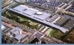
京阪奈開放创新中心

根據國有財產法的特例，實現了將「我的工作館」從國有到京都市的無償轉讓，建成了「京阪奈開放创新中心（KICK）」。 這裡除了透過產學合作開展研究事業外，還作為「京都智慧城市博覽會」等大型活動的會場使用，不斷採取舉措推進以智慧社區領域為核心的國際型開放創新基地的形成。