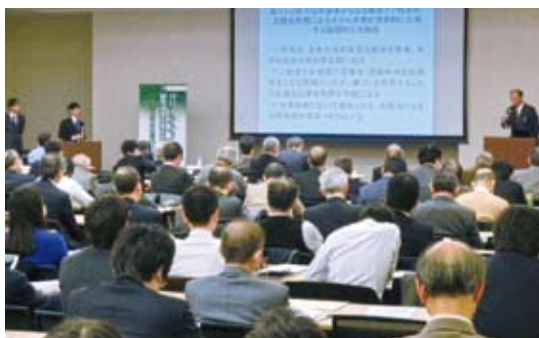
【左】メインホールは約1,700㎡の空間を備え、国際会議や学術会議、展示会などに利用されている 【右】グリーン(新エネルギー)分野への取り組みである「グリーン・イノベーション研究成果企業化促進フォーラム」でも使用された