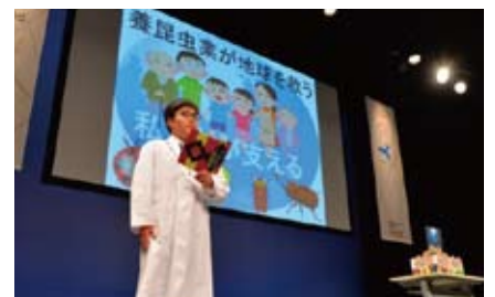
中学生が「未来の仕事」をテーマにプレゼンテーション。 毎年3月に最終選考会が開催される

ミッションに掲げる新たなビジネスの創出や大阪・関西の文化発信でも、ナレッジキャピタルの名は存在感を増している。「特区認定を追い風にして『大阪から世界を変える』を合言葉に、これからも新しい価値を生み出していきたい」。大阪駅周辺地区の「知」の拠点が担う革新的な取り組みの数々。大阪、そして関西の競争力を強化する動きはますます広がりを見せそうだ。