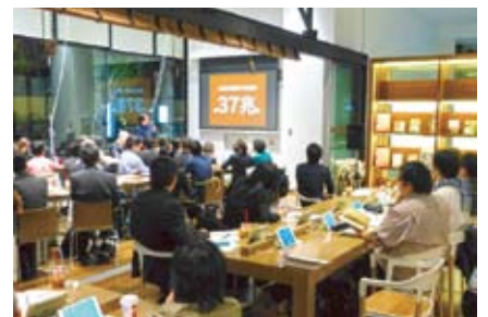
大学や企業と連携し、知のプログラムを提供する 「ナレッジキャピタル超学校」

次世代を見据えた人材育成にも多角的なアプローチで取り組んでいる。大学や企業の研究者と一般参加者が一緒に考え対話する人気