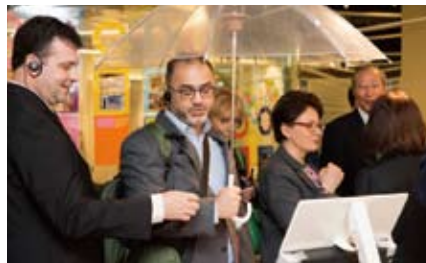
海外からの視察も多く、国際的な連携が進んでいる。 写真は降雨体験ができる大阪大学の作品展示

今後はさらにこうした連携を強化。連携先を広げ、相互交流やマッチングはもちろんだら、連携機関が研究・開発した技術やノウハウをナレッジキャピタルに参画する企業や大学が活用できる仕組みづくりを目指す。